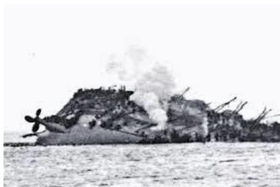
HMT Lancastria - 17 juin 1940, Saint Nazaire

le mercredi 28 mars 2018 à 18h30 à l’amphi Louis de l’Ecole militaire