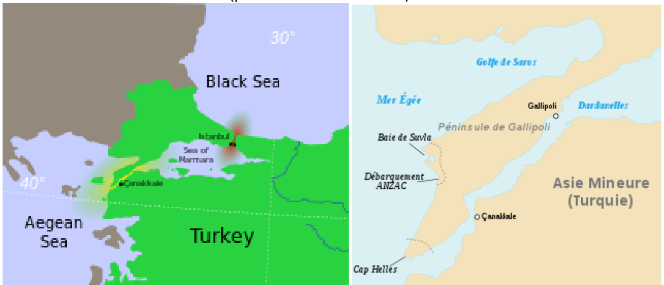
Carte des détroits avec les Dardanelles en jaune et le Bosphore en rouge.

Pendant la Première Guerre mondiale, entre le 25 avril 1915 et le 11 janvier 1916, des forces combinées franco-britanniques s'opposèrent aux forces ottomanes pour prendre le contrôle du détroit des Dardanelles qui faisait déjà partie intégrante de la Turquie. La bataille, dite des Dardanelles ou encore de Gallipoli, devait permettre aux franco-britanniques d'ouvrir une voie de communication maritime stratégique en direction de leur allié russe aux prises à de sérieuses difficultés militaires sur le front ouest et à des troubles intérieurs (prémices de la révolution).