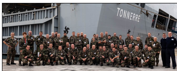
Les 44 marins réservistes participants

Les participants ont tous suspendu temporairement leurs activités privées ou professionnelles, avec l'accord de leur employeur, permettant ainsi à la Marine de remplir l'objectif fixé par la ministre des Armées : « fin 2018, rappeler un effectif limité de la RO2, pour un renfort ponctuel ou un engagement d'urgence ».