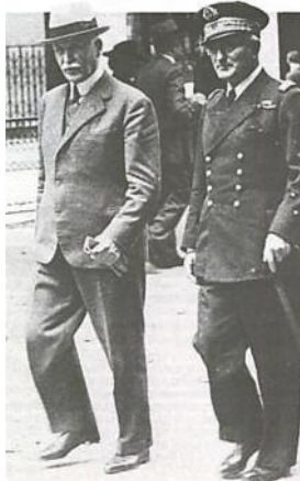
Vichy, le dauphin