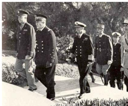
Alger, le rallié

L'Amiral François DARLAN a fait l'objet de nombreux ouvrages et articles.