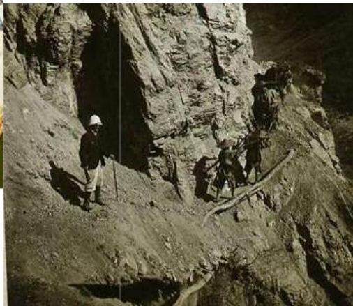
Une vue du chantier

Après de multiples tractations diplomatiques, administratives, financières et des tensions avec les autorités chinoises, la voie ferrée s'est construite au prix de nombreux morts et accidents. En particulier dans la partie entre la frontière chinoise et le plateau du Yunnan où de très nombreux ouvrages d'art ont dû être construits pour permettre au chemin de fer de "gravir" à travers un chaos calcaire et tropical, quelques 1.800 m de dénivelé sur environ 150kms.